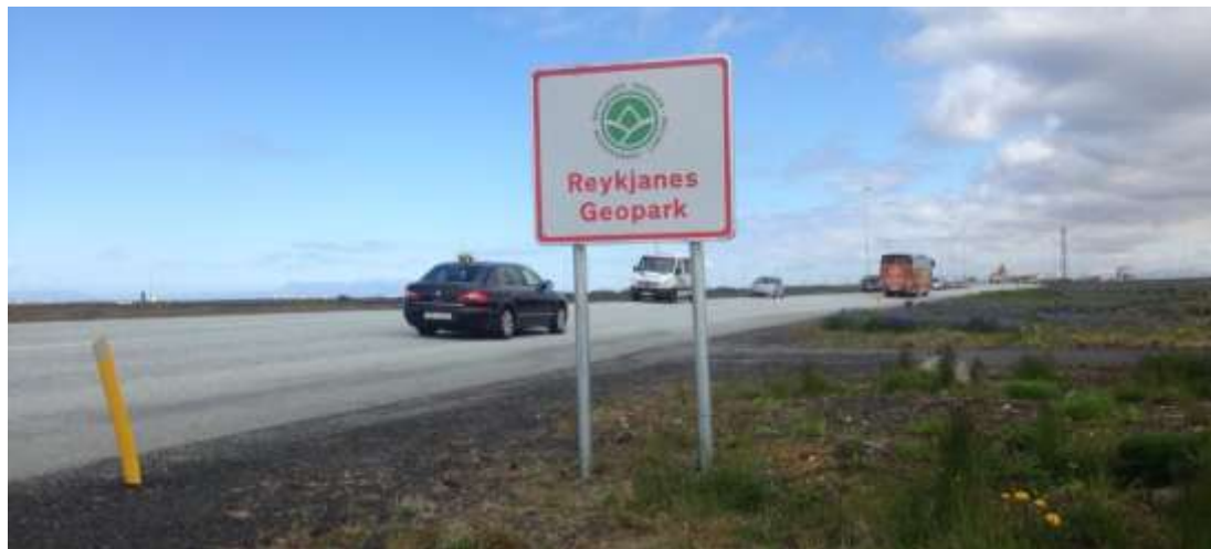
Innkomuhlið í Reykjanes Geopark við Flugstöð Leifs Eiríkssonar

Sett hafa verið upp fjögur innkomuhlið í Reykjanes jarðvang, þ.e. við Reykjanesbraut, Flugstöð Leifs Eiríkssonar, Suðurstrandarveg og Krýsuvíkurveg.