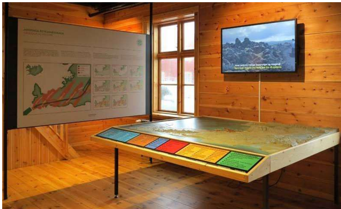
Úr Gestastofu Reykjanes Geopark í Duushúsum

Gestastofan nýtist heimamönnum og ferðamönnum auk þess sem stofan hentar vel skólum og nemendahópum. Gestastofan þjónar sem upplýsingamiðstöð í Reykjanesbæ og er skilgreind sem landslutamiðstöð sem miðlar upplýsingum um ferðapjónustu á Reykjanesinu öllu.