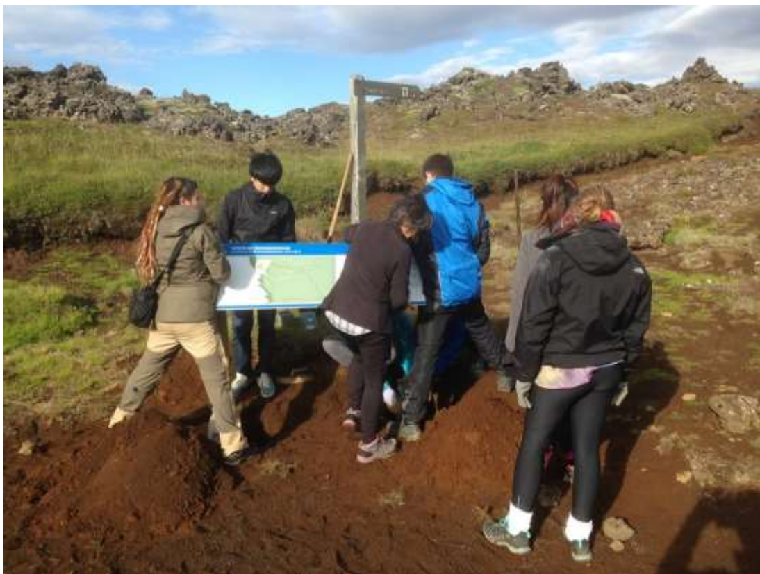
Unnið að merkingum við Húshólma í ágúst 2015

Stjórn jarðvangsins fundaði með sviðsstjóra náttúru hjá Umhverfisstofnun í nóvember 2014 og stjórn Framkvæmdasjóðs ferðamannastaða í mars 2015. Lýsti stjórn Framkvæmdasjóðs yfir mikilli ánægju með þá samstöðu og stefnumörkun sem Reykjanesið hefur gengið í gegnum í tengslum við umsókn að European Geopark Network, sem gæti orðið öðrum svæðum til fyrirmyndar.